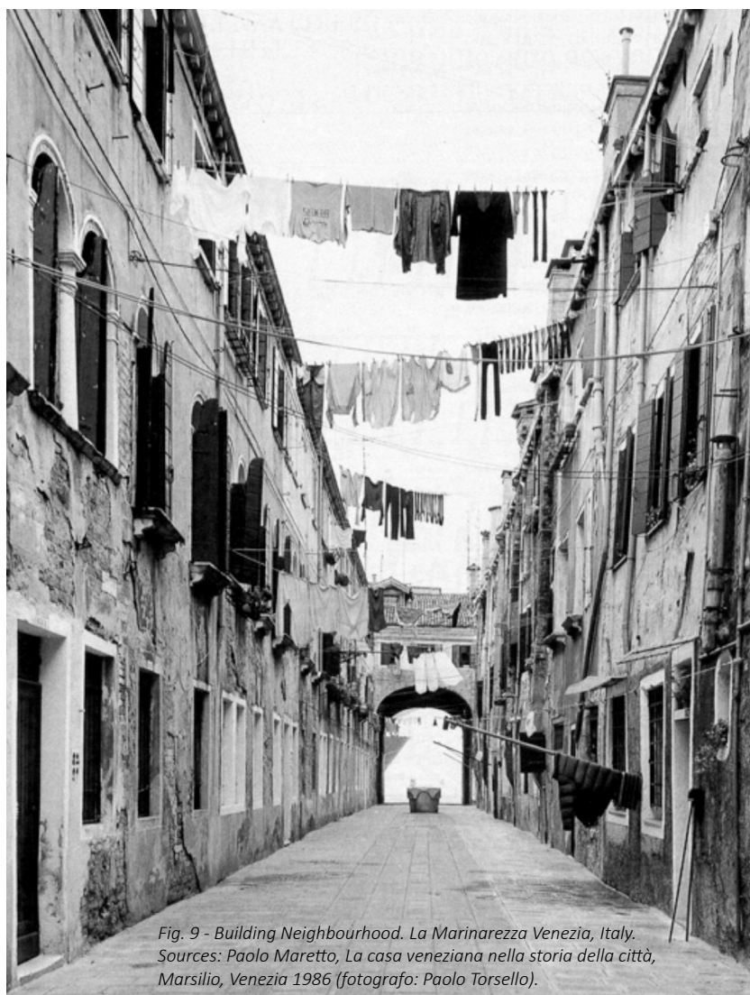
Fig. 9 - Building Neighbourhood. La Marinarezza Venezia, Italy. Sources: Paolo Maretto, La casa veneziana nella storia della città , Marsilio, Venezia 1986 (fotografo: Paolo Torsello).

attribuzione di priorità il mondo si porrebbe alla nostra attenzione come una massa compatta indecifrabile, una matassa da cui non riusciremmo a venire fuori. Priorità quotidiane e priorità di lungo termine, istintive e programmatiche, private e collettive, tutte concorrono alla definizione di un sistema mutevole di gerarchie. Le gerarchie costituiscono, dunque, i “punti geo-referenziati” della mappa del nostro abitare, ci danno una scala di valori, individuali e collettivi, su cui fondare la lettura critica di una città, ci danno i riferimenti dinamici su cui fondare il suo progetto di trasformazione.