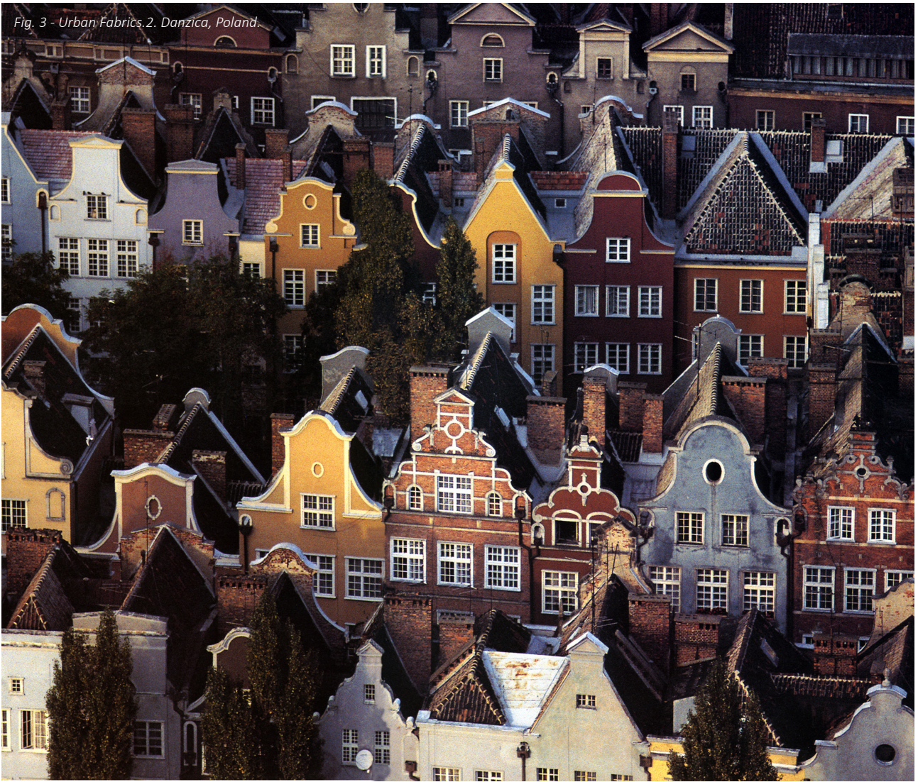
Fig. 3 - Urban Fabrics, 2. Danzica, Poland.

Una struttura che si pone alla base di qualunque successiva organizzazione fondiaria e sociale. Ma questa struttura, anche negli insediamenti rurali delle civiltà stanziali più primitive, è sempre espressione di un'analogia, seppur elementare, struttura sociale con tutto quell'insieme di polarizzazioni e gerarchizzazioni spaziali comuni che identificano una comunità. Una comunità che tende a "radunarsi e identificarsi", dunque, in spazi collettivi dal valore aggregante.