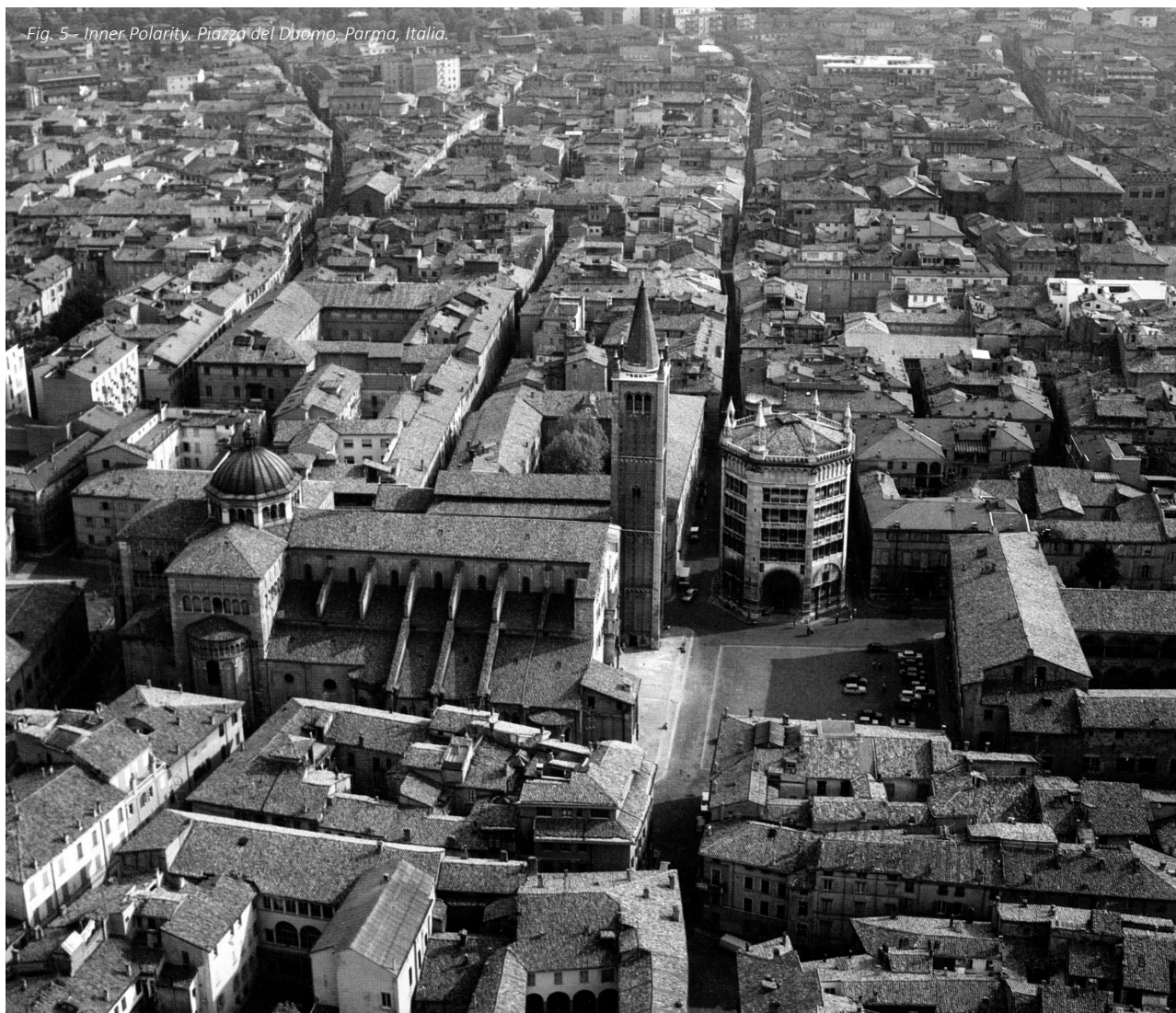
Fig. 5 - Inner Polarity. Piazza del Duomo, Parma, Italia.