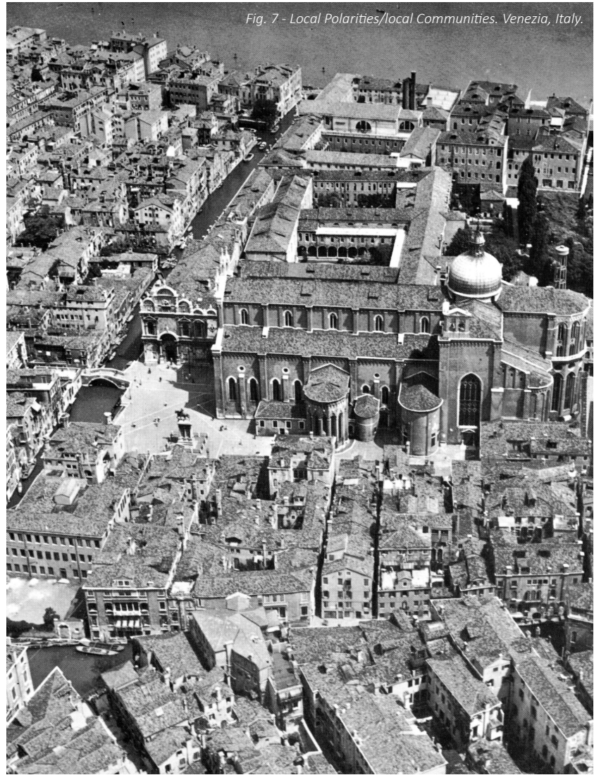
Fig. 7 - Local Polarities/local Communities. Venezia, Italy.