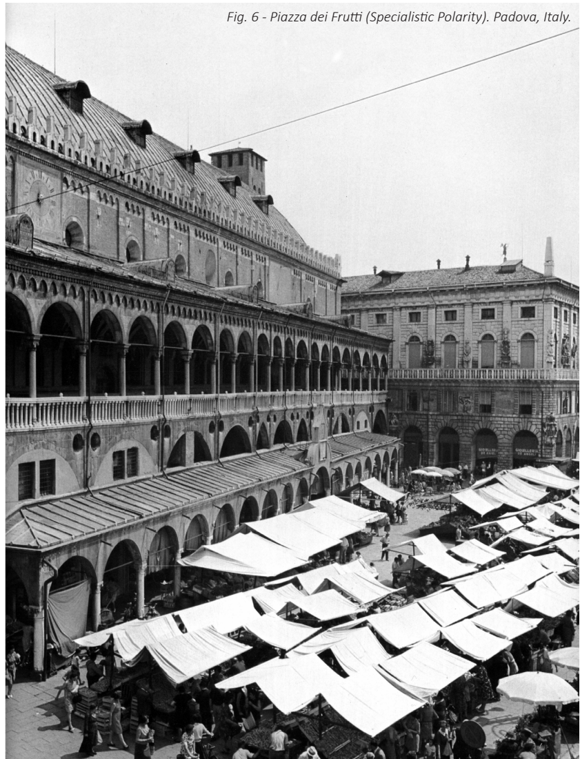
Fig. 6 - Piazza dei Frutti (Specialistic Polarity). Padova, Italy.