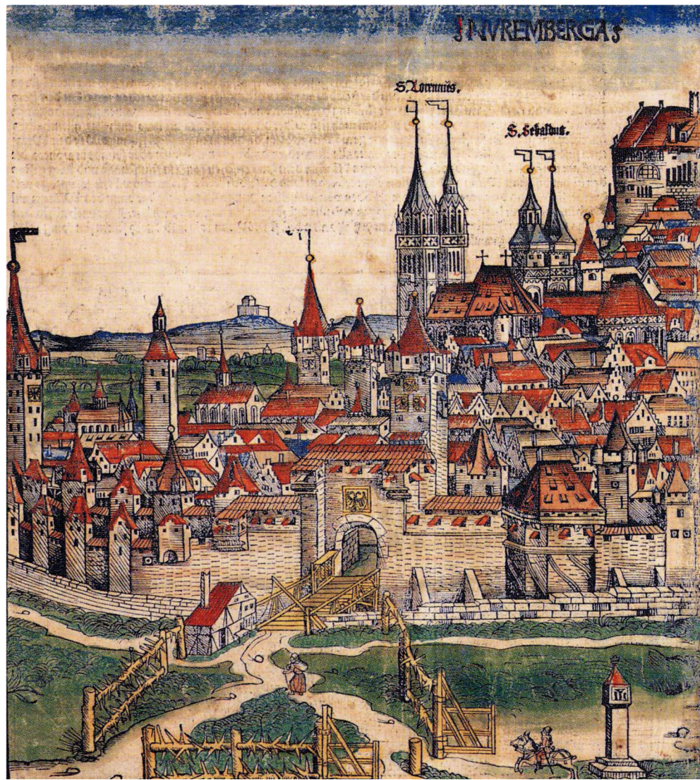
Fig. 4 - Polarities. Nuremberg. Sources: H. Schedel, Liber Chronicarum, xilografia, 1493.

sustainable strategies with the various cultural, social, civic and formal aspects of urban design and architecture, according to a comprehensive and complex idea of sustainability, that can only be fully accomplished through a renewal of civic awareness, a different use of resources, a different pattern of settlement on the territory. However, the information revolution is already radically transforming the very foundations of the “fossil city”, exponentially increasing the opportunities for exchange in the new global society. On the one hand, the daily movement range has been progressively reduced; on the other, a “virtual” macro-urbanism will intersect with an “actual” micro-urbanism, physical and concrete, determining the form of the new urban environment. Within the binomial of macro and micro urbanism, urban morphology identifies an interesting socio-building scale which can serve as the basic strategy for sustainable city planning in the XXI century. A strategy that involves, on the one hand, a scalar sequence of physical forms related to aggregation and spatial organization (from houses all the way up to districts); on the other, a complementary sequence of forms related to association and civic organization (from families to urban communities). Sequences that find in the concept of “social neighborhood building” the lowest common denominator of sustainability: the sustainable unit, on which urban strategies of environmental control on a larger scale