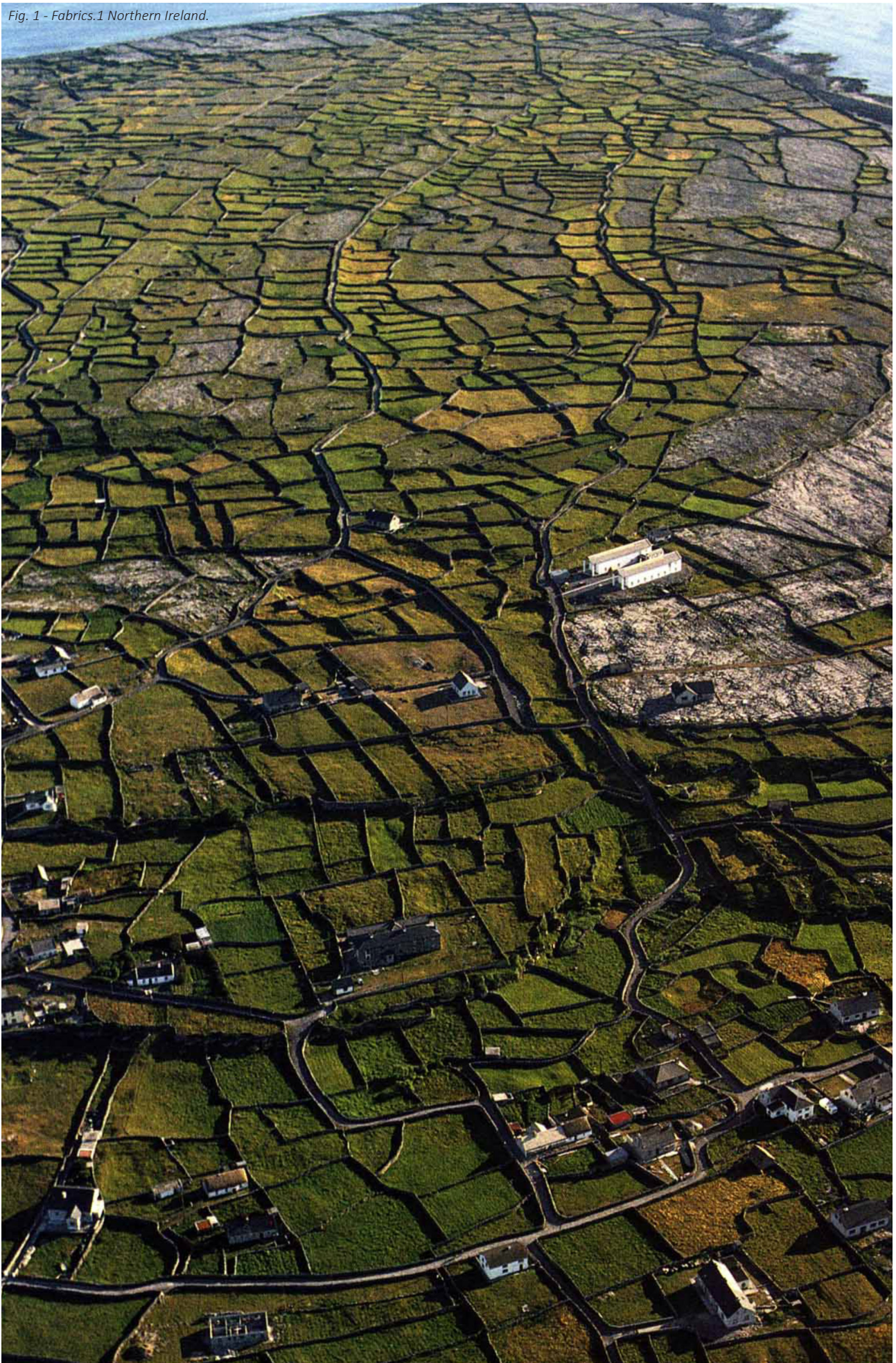
Fig. 1 - Fabrics.1 Northern Ireland.