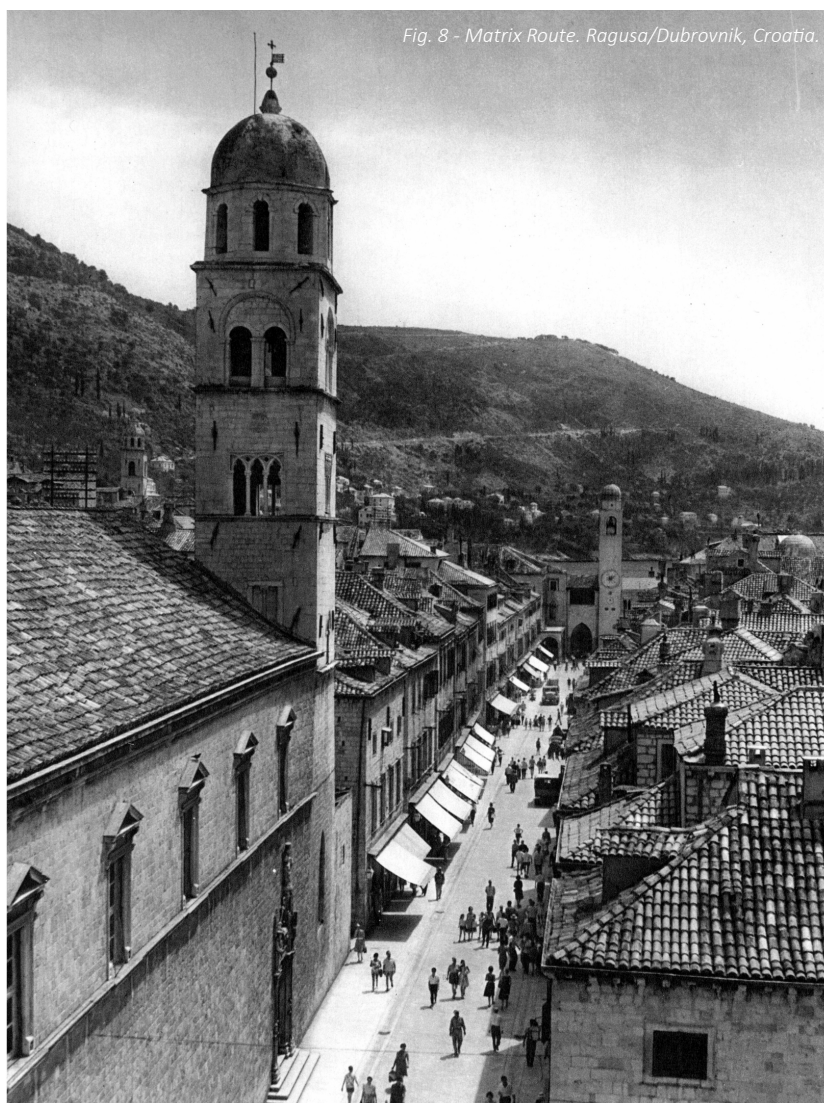
Fig. 8 - Matrix Route. Ragusa/Dubrovnik, Croatia.

There is a system of built structures which has the essential task is to mediate the transition between the citi-zen's (or family's) individual, sociological dimension and the city's public dimension. The more complex the public dimension is, the more important the role played by the structures in the functioning of an urban organ-ism. Such structures, at the same time physical and social, are the result of "neighborhood social building", and have been entrusted for centuries with an important role in building the city. The neighborhood, in fact, alt-hough it represents the indispensable link between families (small-scale) and communities (large scale), is gener-ally non-institutionalized, and essentially recognizable only in a building context. Identifying the neighborhood unit was, for centuries, the fundamental tool used for urban and building planning. Perhaps the most considera-ble historic example is that of