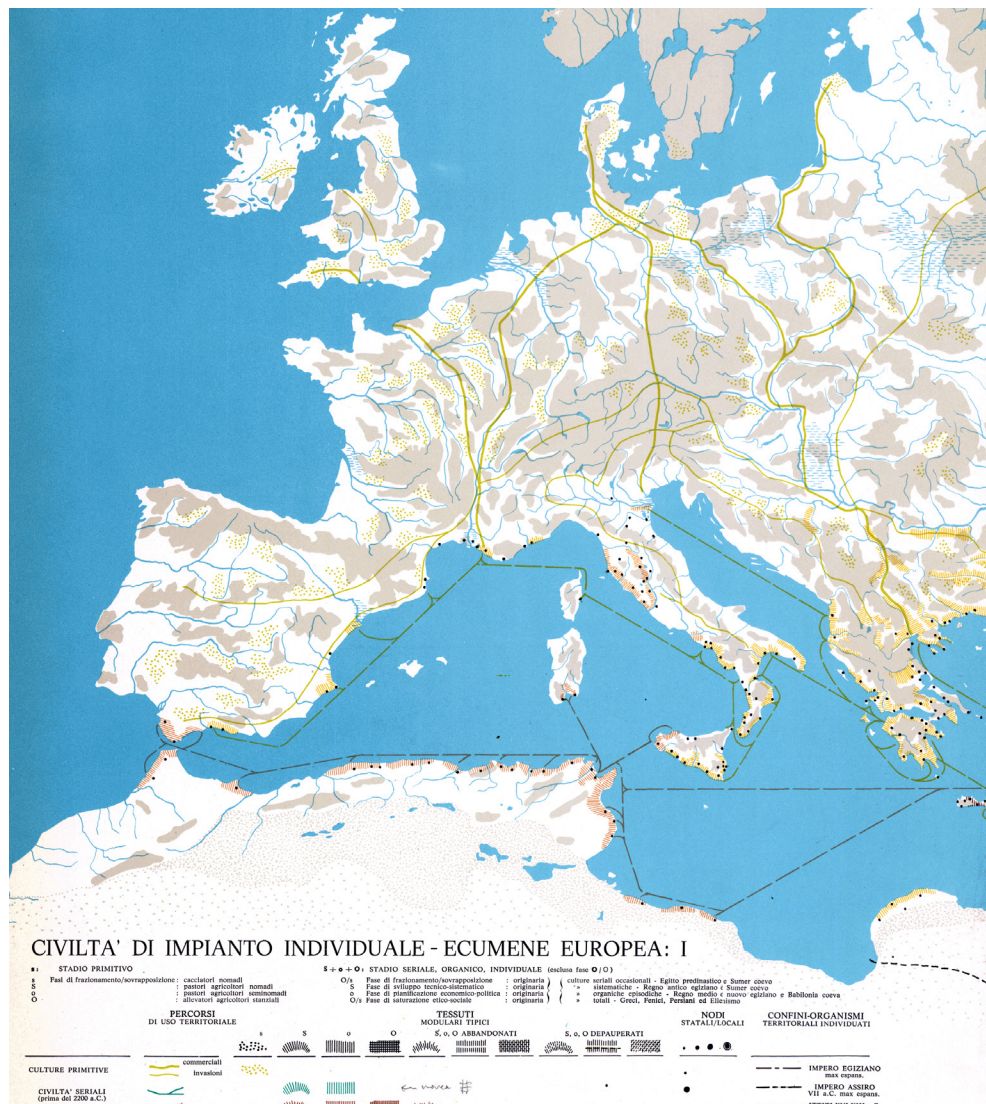
Fig. 2 - S. Muratori, Minute dell'Atlante Incompiuto , riordinato da Alessandro Giannini.

of cross-referenced abscissae and ordinates, where the subject and object are both present', a summary of Muratori's approach, was the key to understanding architecture and territory at all scales, including that of the territory of the Ancient Roman Empire that came out in lecture notes issued in 1980 with a booklet devoted to L'Individuo Territoriale , influenced by Muratori's never-published Atlante . A series of well-drawn tables picture the formation of the Mediterranean world and the whole of Europe. Giannini had a good hand and the ability to portray concisely a scale image of an imaginary territory that helps understand the real one. His L'Individuo Territoriale completed a series of lecture notes issued in 1976: Sistemi e Polarità ; Serialità ; La Struttura del Reale ; Il Tipo Territoriale ; Il Tessuto Territoriale ; L'Organismo Territoriale . His personal reworkings of Muratori's concerns, as found in these notes, applied to the concrete reality of the region of Liguria, laid the theoretical foundations for Studi di Ambiente Ligure , published in 1980. Here, the territory was handled by introducing the environmental question as a cultural problem. This is what allows us to become aware of it and defend its values, starting from the things that are closest to our daily lives, such as choosing materials for a fence or outdoor paving that are consistent with the language of a place, disregarding the products found on the market or taking them into consideration.