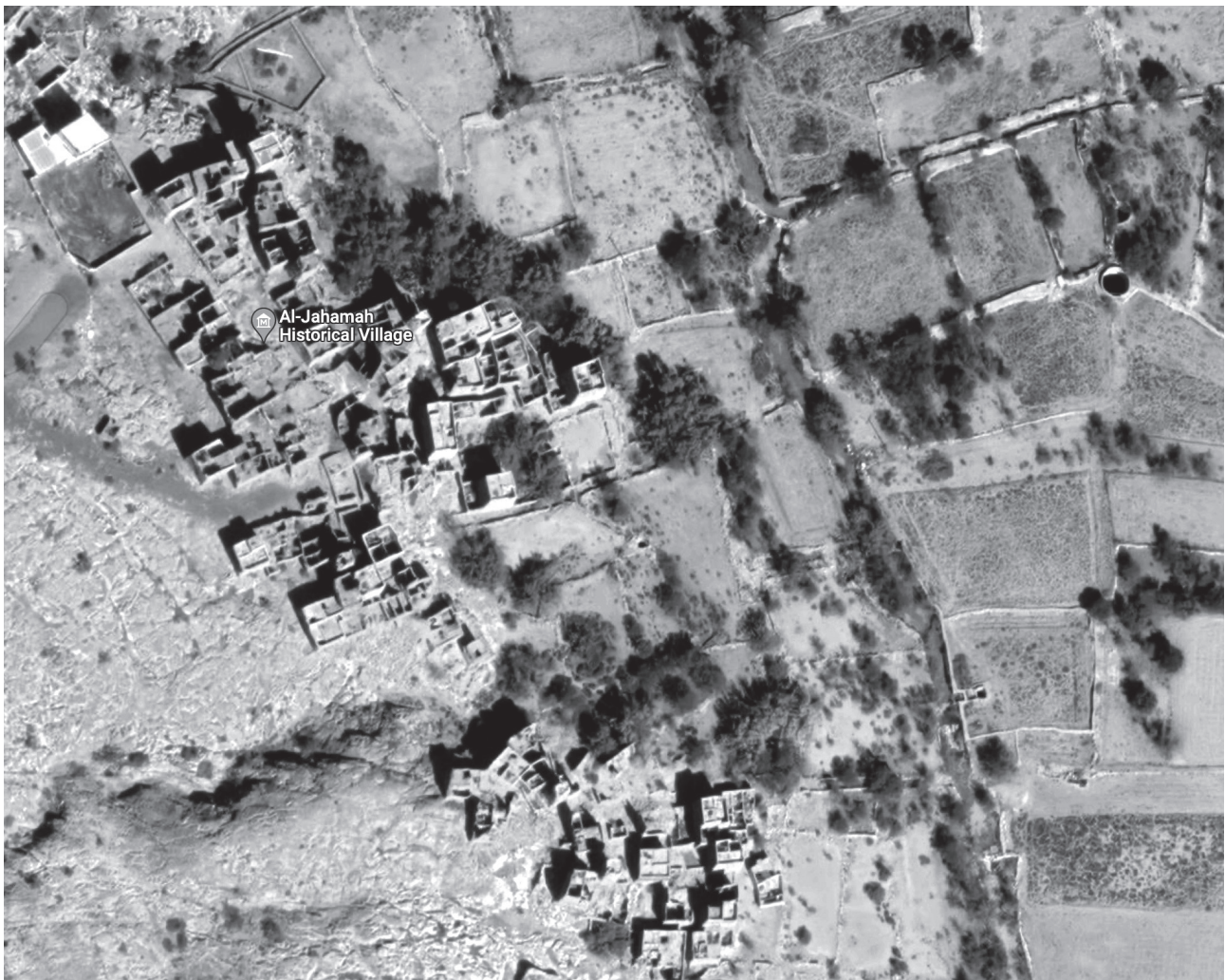
Fig. 3 - L'insediamento storico di Al-Jahamah e gerarchia dei percorsi con i terreni agricoli. Google Earth.

Historical settlement of Al-Jahamah and hierarchy of the different paths with the agricultural lands. Google Earth.