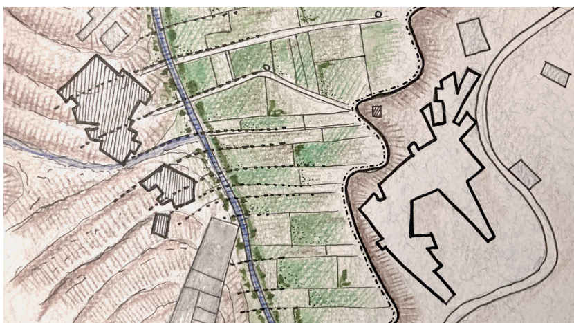
Fig. 6 - Vecchi agglomerati residenziali (a sinistra) e nuove unità residenziali (a destra). Disegno dell'autore.

Old Residential clusters (left) and new residential units (right).