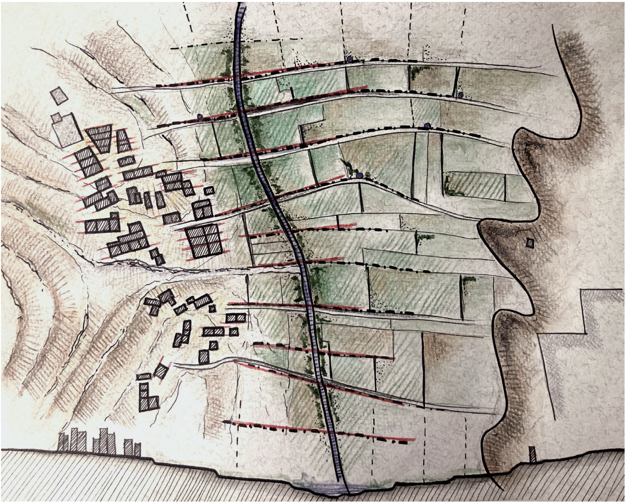
Fig. 4 - Insediamento storico di Al-Jahamah e i suoi terreni agricoli. Disegno dell'autore. Historical settlement of Al-Jahamah and its agricultural lands. Author's drawing.

Questo perché l'ambiente urbano funge da intermediario tra i gruppi tribali semi-autonomi e la fonte centrale di influenza politica e culturale. L'architettura tradizionale viene quindi diluita dai tentativi governativi di modernizzare le aree urbane. Quello che un tempo, ad Al-Jahamah , era un paesaggio fiorente, composto di comunità agricole autosufficienti, ha lasciato il posto a una sfilza di case suburbane moderne, che non rendono omaggio al patrimonio culturale regionale. Molti elementi, come l'orientamento e la rete stradale, dimostrano l'inesistenza di legami tra le terre agricole e il nuovo villaggio, che risulta isolato dal resto del contesto (fig. 7).