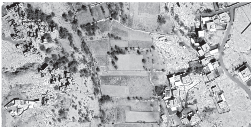
Fig. 5 - Vecchi agglomerati residenziali (a sinistra) e nuove unità residenziali (a destra). Google Earth.

According to Giuseppe Strappa, the value of history, in an innovative and fertile meaning for the contemporary city, is at the roots of modern re-foundation: we cannot reduce the complexity and richness of the ancient patterns that classify types and processes (Scardigno, 2023). In other words, there is a major necessity in understanding the forming process of the existing/historic built landscape and its relation to its territory before any attempt of designing a new urban center. In the case of the historical town of Al-Jahamah, it is clear that no reading of the character of the town nor its aptitude for transformation has been done. First, there is no relationship between the historic built landscape and the new one. It is evident how the old structures are blending very well with the landscape whereas on the contrary, the new structures have no link with the old one and are very imposing (fig. 8). Second, a cut between the circulation network of the old settlement and the new one is observed. The pathways and small alleys do not extend into the new urban fabric. Third, a big difference in the scale of one housing unit between the two areas is observed. Passing from a more or less 8mx16m plot in the historical village to a 26mx34m plot in the new village, we can say that the result of the new town did not derive from a morphological, interpretative and adaptation of its territory. It is not a "formative"