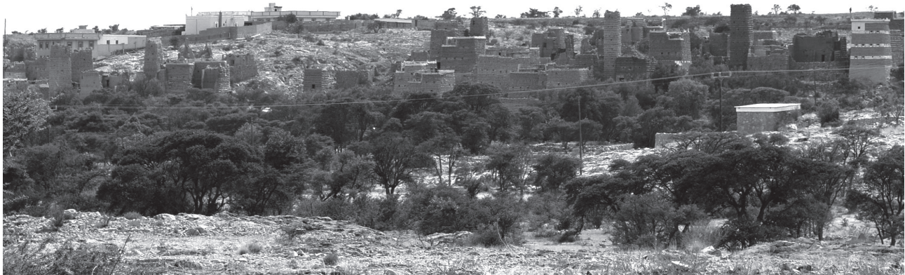
Fig. 2 - La città storica di Al-Jahamah che si fonde con il paesaggio naturale in pendenza. Historical town of Al-Jahamah's townscape blending into the sloping natural landscape.

Questo fenomeno si osserva nell'insediamento di Al-Jahamah , dove si trovano torri difensive rotonde in luoghi strategici (di solito vicino ai campi agricoli) e corsi d'acqua naturali che si intersecano con il wadi , permettendo l'irrigazione delle terrazze agricole (Klingmann, 2022). Inoltre, il suolo leggermente inclinato ha permesso la costruzione degli edifici storici su un terreno elevato (fig. 4). In questo modo, gli abitanti potevano affacciarsi sui propri campi coltivati anche quando si trovavano nelle loro case.