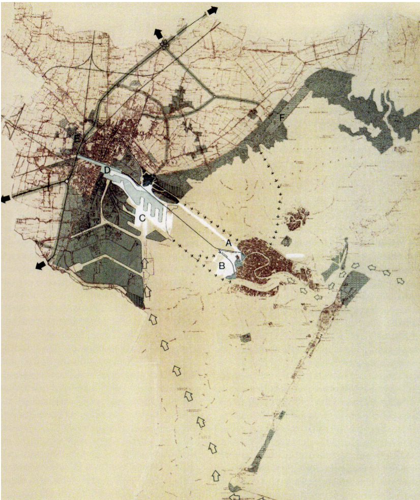
Fig. 4 - Concorso per la Sacca del Tronchetto, Venezia. Progetto Novissime, G. Samonà e altri, 1964. (AP. IUAV, Fondo G. Polesello).

Competition for the Sacca del Tronchetto, Venice. Project Novissime, G. Samonà and others, 1964. (AP. IUAV, Fondo G. Polesello).